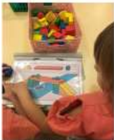
Техническое по схемам