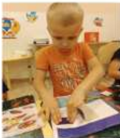
Художественное из бумаги