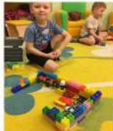
Техническое по замыслу