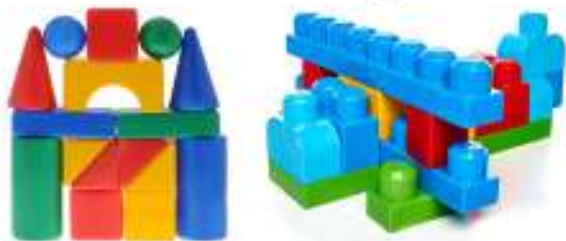
- Крупный (Напольный)