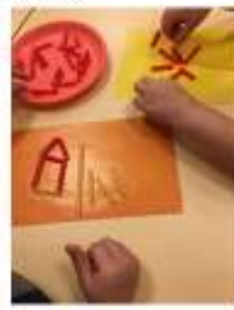
Художественное из природного и бросового материала